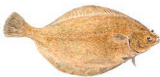
かれい (マコガレイ Marbled sole)

宮城ではリアス式海岸の良湾という環境を活かして、全国に先駆けて養殖に成功しました。刺身やマリネの他、ムニエルなどにして食べるのもお勧めです。