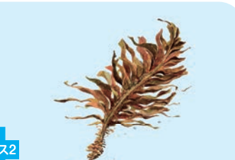
わかめ (Brown seaweed)