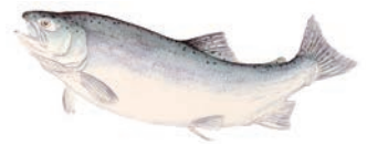
ぎんざけ (Coho salmon)

秋の味覚といえば脂ののったサンマ。古くから庶民の味として愛され、ミネラルやビタミンを豊富に含んだ健康食品としても知られています。