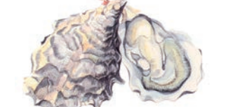
かき (マガキ Gigant pacific oyster)

清流の女王アユ。宮城県では都心部の川でも天然魚が釣れると話題です。香魚ともいわれるアユの香りとその美しい姿態を楽しめる塩焼きは、まさに絶品。