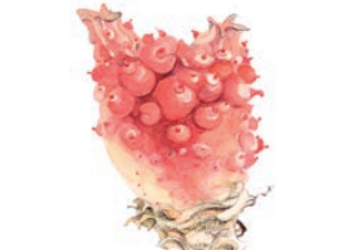
ほや (マボヤ Sea squirt)

上品な磯の香りと、柔らかな歯ごたえはまさに南三陸の海を代表する味。刺身、蒸しもの、焼きもの他に、肝の塩辛、酢の物など通の味としても知られています。