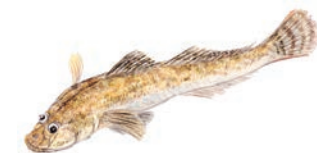
はぜ (Yellowfin goby)

広大な砂浜域のある仙台湾は、カレイにとってまさに最高の生活圏。古くから知られた宮城の味です。