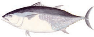
まぐろ (Bluefin tuna)