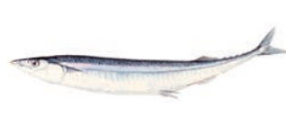
さんま (Pacific saury)

寒流と暖流の交わる金華山沖漁場の代表魚。青葉の頃の「初鯷」が知られていますが、秋口の「もどり」カツオは脂ののっていいそうおいしいといわれています。