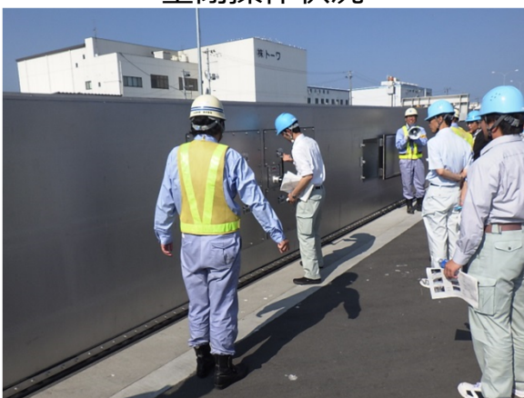
手動ハンドル操作状況