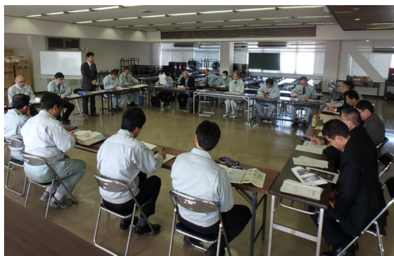
▲ 技術検討委員会の様子

委員会では、農業農村整備部から、石巻市大川地区及び東松島市洲崎地区の復旧に関する検討事項と石巻地域の災害復旧状況を説明し、続いて、農業振興部から圏域の農業復興状況を報告しました。その後、先に説明した事項について専門委員から助言を受け、更なる課題の洗い出しや課題に対する解決策を検討しました。