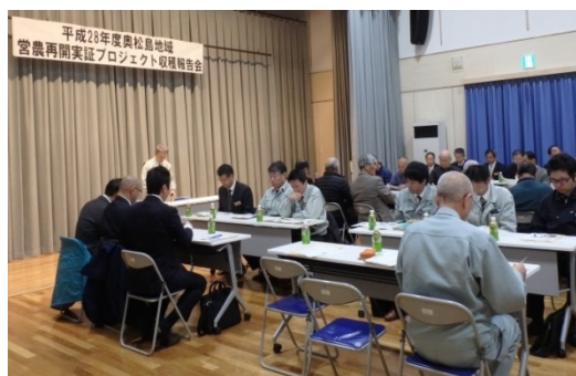
▲実証プロジェクト報告会の様子

平成28年12月27日、東松島市の野蒜市民センターにおいて、「平成28年度奥松島営農再開実証プロジェクト報告会」が開催され、集まった地域農業者や復旧・復興に携わる関係者約60人に向けて、野蒜地区洲崎及び宮戸地区で実施する当プロジェクトの結果報告がありました。