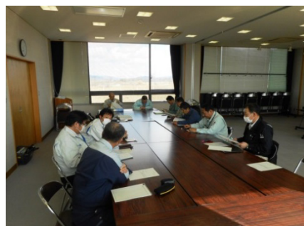
▲ 鹿又・広淵沼地区戦略会議 (平成29年3月8日)