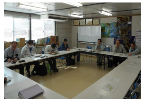
▲ 北上地区戦略会議 (平成29年3月9日)