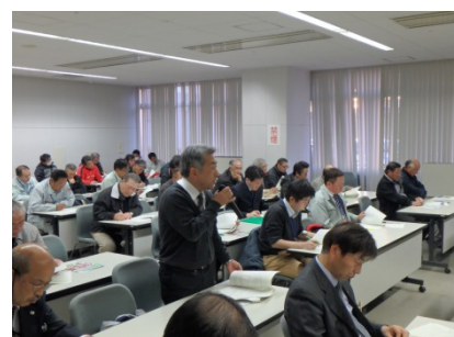
▲受講者からは多くの質問がありました