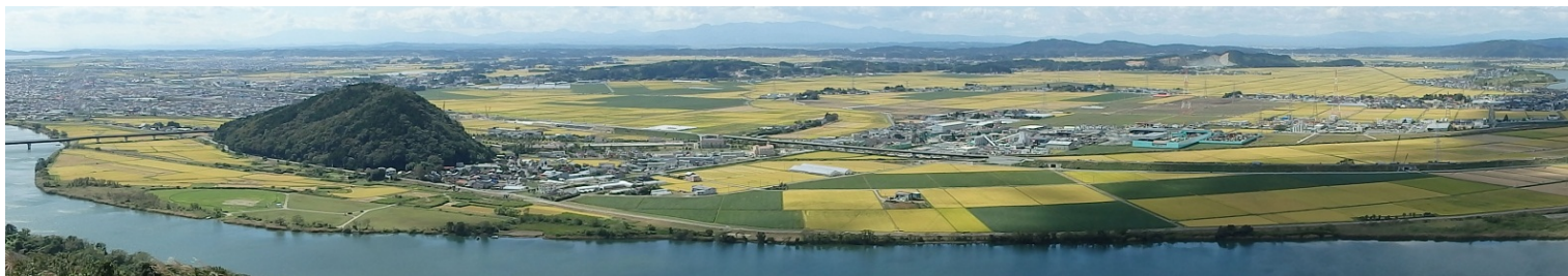
トヤケ森から望む石巻管内の風景

「いしのまきNN通信」は、石巻地域の農業農村整備事業に関連する活動等を広くお知らせすることを目的に、年3回程度発行しています。掲載希望の情報等がありましたら農村振興班までご一報ください。今後ともよろしくお願ひします。