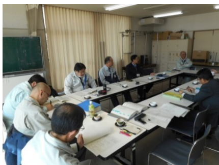
▲ 西矢本地区戦略会議 (平成29年3月7日)