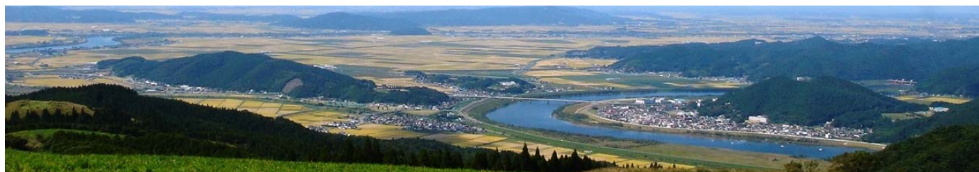
上品山山頂より望む石巻管内の風景

「いしのまきNN通信」は、石巻地域の農業農村整備事業に関連する活動を広くお知らせすることを目的に、年3回程度発行しています。掲載希望の情報等がありましたら農村振興班までご一報ください。今後ともよろしく申し上げます。