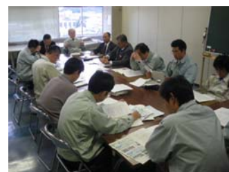
H22. 10. 27 発足会の様子

今後は、 カキ殻の活用方法に加え、生産者側と利用者側のルールづくりも視野に入れ検討 していきます。