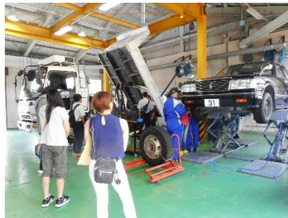
自動車のタイヤ脱着体験（自動車整備科）

オープンキャンパスでは、各科で行っている日々の訓練について、指導員と学生たちが体験と見学を通して分かりやすく説明します。