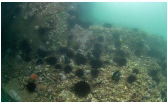
ウニの増えすぎにより“磯焼け”が発生した海域