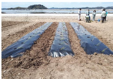
定植したアスパラガス

東松島市・宮戸地域では、今年度、“試験栽培”を実施しています。この試験栽培は、災害復旧事業を実施したものの、農道が狭小でトラクター等の大型機械の往来が難しいほ場や、水供給が無く天水頼りの営農とならざるを得ないほ場での、営農のあり方を検討するために行うものです。