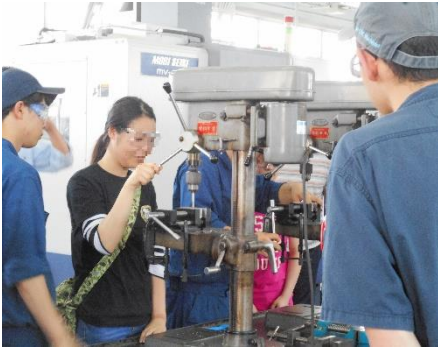
ボール盤で金属に穴を空ける体験（金属加工科）