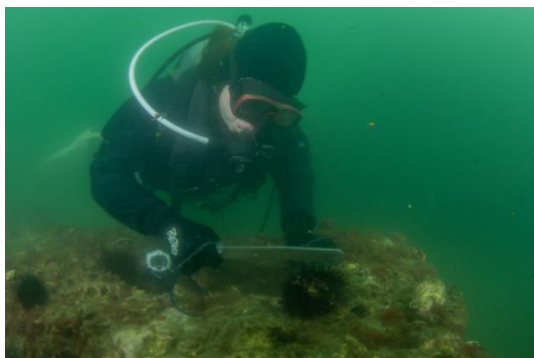
海中でのウニの駆除活動の様子

みなさんは“磯焼け(いそやけ)”という言葉をご存じでしょうか。磯焼けとは、コンブやアマモなどの海藻(草)類が群生し、多くの海洋生物の生活を支える藻場(もば)が、急激な自然環境の変化や、海藻を食べるウニなどが増えすぎる食害が原因で発生すると考えられており、“藻場(もば)”が消失してしまう現象のことで、「海の砂漠化」ともいわれています。県内でも各地で磯焼けが進み、生態系や沿岸漁業への影響が懸念されています。