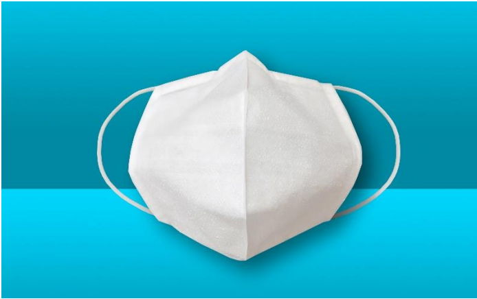
「オリマスク」完成品

新型コロナウイルス感染症が世界中で猛威を振るっており、国内の大手企業が新たにマスク製造に参入するなど、今後もその需要が見込まれています。