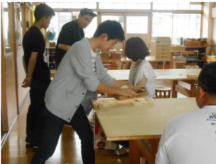
かなで木材を削る体験（木工科）

7月18日（土）と8月30日（日）に石巻高等技術専門校で、オープンキャンパスを行います。（両日とも午後1時から）