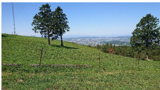
河北上品山牧場の牧草地

2011年の東京電力株式会社福島第一原子力発電所事故が発生してから9年が過ぎましたが、今も食品衛生法で定められた食品中の放射性物質の基準を超えない、安全な畜産物を生産するための取組を行っています。