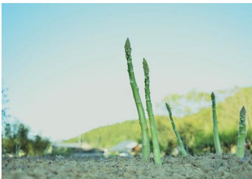
収穫直前のアスパラ