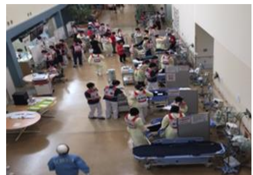
【訓練での患者受け入れの様子】

今回の訓練では、停電が長期間に及ぶことが予測される大規模災害が発生した際に、在宅酸素療法患者（HOT患者）の院内避難所となる「HOTセンター」の設置訓練も新たに行いました。