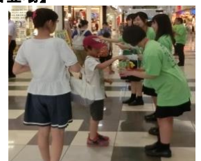
【高校生ボランティア募金活動中】