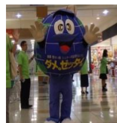
【「ダメ。ゼッタイ。」君登場】

今後も石巻保健所では、積極的にキャンペーン活動を実施していきますので、よろしくお願いいたします。