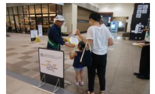
【食中毒予防の呼びかけ】

7月31日（月）に石巻保健所及び石巻地区食品環境衛生団体連合会はイオンモール石巻で食中毒予防キャンペーンを行いました。来場者に食中毒予防を呼びかけ、啓発用のうちわ700本を配布しました。気温の高いこの時期は、手洗いや食材の温度管理をしっかりと行い、食中毒を予防しましょう。