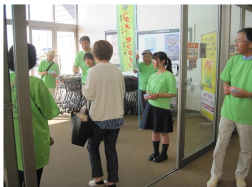
【啓発グッズ配布中】