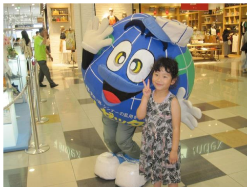
【「ダメ。ゼッタイ。」君と記念撮影】

薬物乱用は「ダメ。ゼッタイ。」今後も石巻保健所では、積極的にキャンペーン活動を実施していきますので、よろしくお願いします。