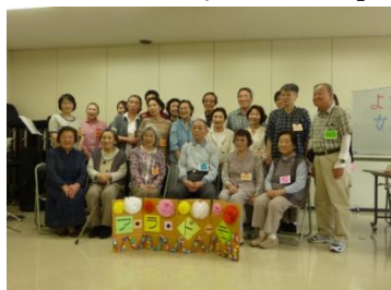
【参加された皆さん】

今後、石巻市、利府町、美里町等でも開催されるほか、10月には女川町の復興の状況を見ていただくための「女川ツアー」も計画されています。