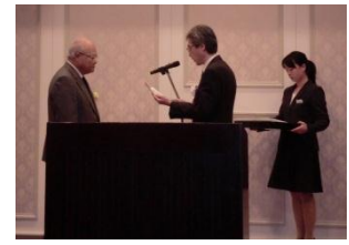
石巻グランドホテルでの表彰の様子(5月17日)