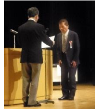
河北総合センターでの表彰の様子(5月28日)