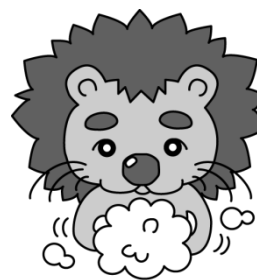
石巻保健所 オリジナルキャラクター 「てあらいおん」

また、当所では毎月1回、感染症かわら版を発行し、ホームページに掲載しています。ぜひご覧ください。