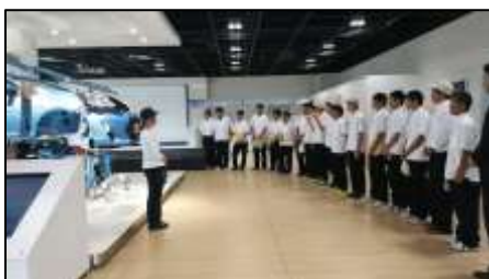
ものづくり企業見学