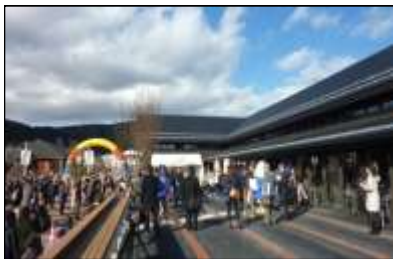
シーパルピア女川