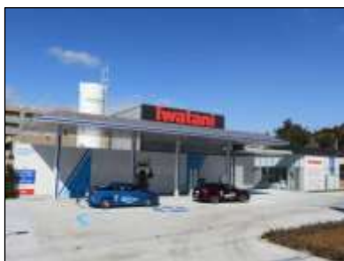
東北初の商用水素ステーション