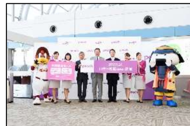
Peach Aviationの仙台空港 拠点化に伴う就航セレモニー