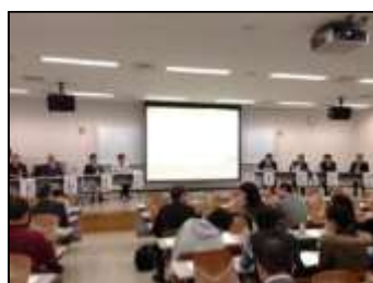
石巻地域包括支援シンポジウム