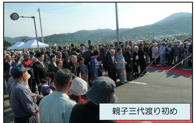
親子三代渡り初め