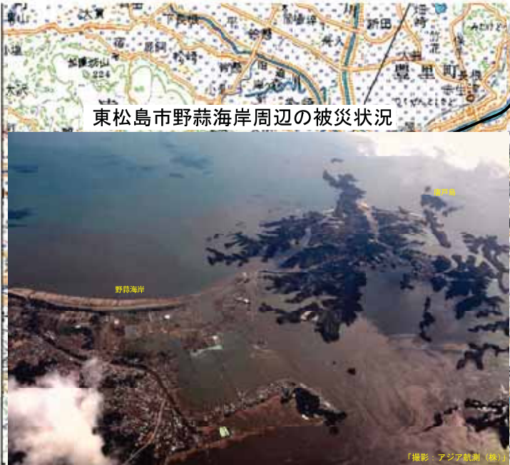
東松島市野蒜海岸周辺の被災状況