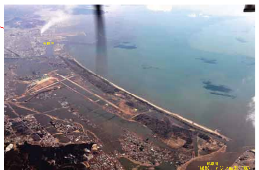
東松島市矢本の被災状況