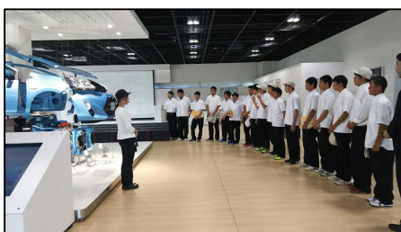
ものづくり企業見学