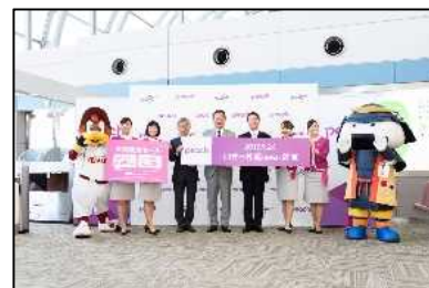
Peach Aviation の仙台空港 拠点化に伴う就航セレモニー