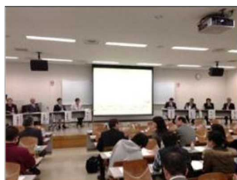
石巻地域包括支援シンポジウム