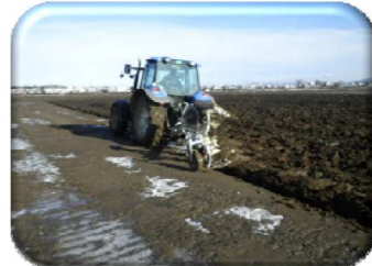
④炭酸カルシウムの散布