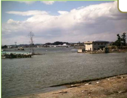
海水・ガレキ等の侵入