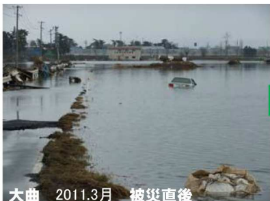
大曲 2011.3月 被災直後