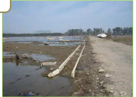
津波による土砂の堆積