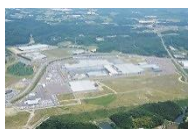
製造業の集積が進む 仙台北部中核工業団地

企業立地奨励金等のインセンティブの強化や今後不足が懸念される事業用地の確保・整備の促進