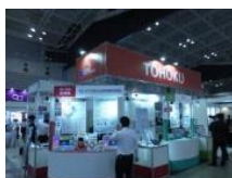
販路拡大に向けたICT技術の展示会

起業や産業の創出・育成に向けたICTのフル活用や農林水産業、観光業等をはじめとする様々な分野でのICT利活用の促進