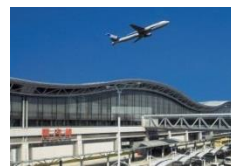
東北のプライマリーゲートウェイを目指す仙台空港

仙台空港民営化を契機とした航空需要の拡大と航空路線の誘致活動（エアポートセールス）の強化や、企業誘致などによる空港周辺地域の活性化