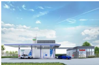
東北初の商用水素ステーション