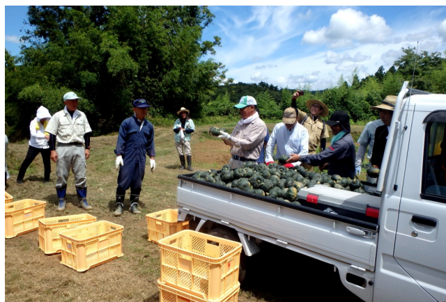
ボランティア作業の様子②

今回のボランティア活動では、「味来」のほ場の片付け、カボチャの収穫が行われ、午後には「柳津虚空蔵尊」や「旧北上川分流施設」を見学しました。また、参加者らは、昼食に「味来」のゆでたものやコーンポタージュ、夏野菜カレーなどが振る舞われ、美味しそうに味わっていました。