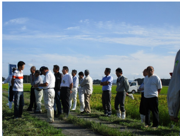
「だて正夢」現地検討会の様子②