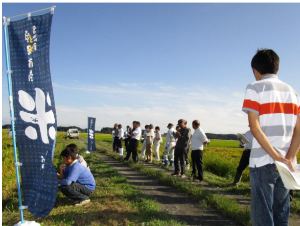
「だて正夢」現地検討会の様子①