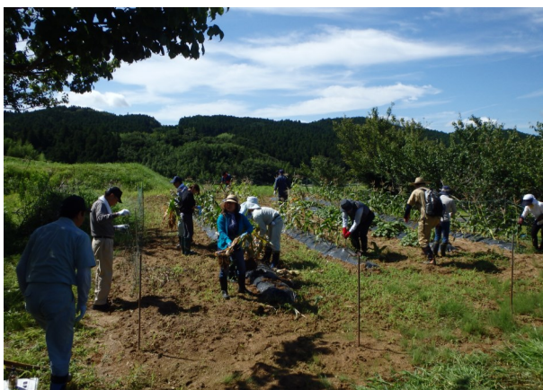
ボランティア作業の様子①

登米市津山町柳津にある沢田集落で、「味来」(とうもろこし)の援農ボランティア活動が8月18日に行われました。この事業は、人口減少の著しい農山村集落において、援農ボランティアの受入体制づくり等を支援し、活性化を図る「農山村集落体制づくり支援事業」で、昨年から取り組んでいます。