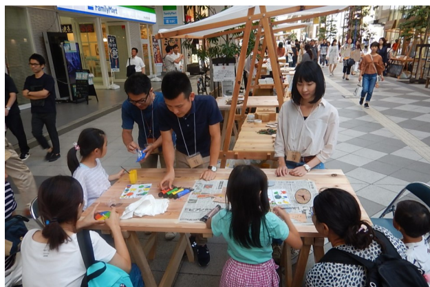
木育イベントの様子

となるよう、具体的な支援方法について関係者と調整を図りながら取り組んでいきたいと思えます。