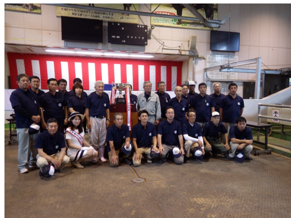
肉用牛の部で団体賞を受賞した登米地区の皆さん