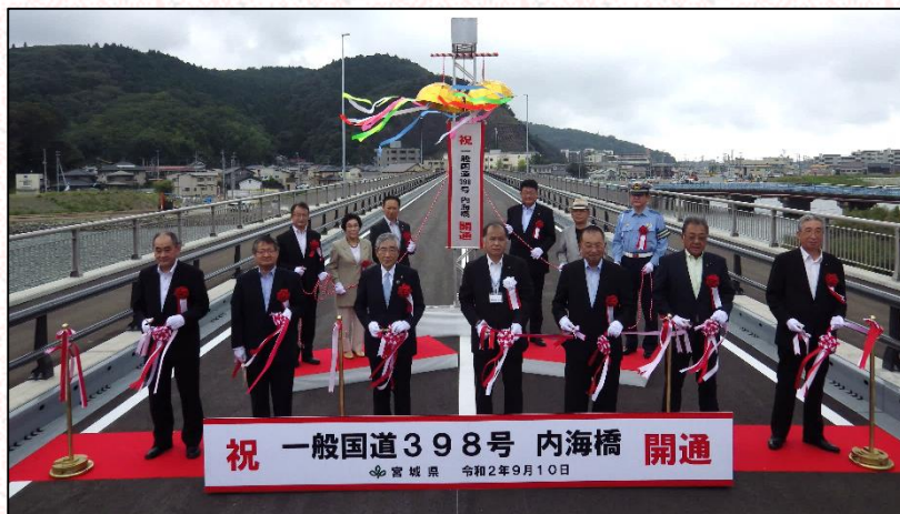
テープカット及びくす玉開披の様子

供用開始に先立ち開催した開通式には、石巻市長をはじめ県議会議員、石巻市議会議員、北上川下流河川事務所長、石巻警察署長、石巻商工会議所会頭、中央地区・湊地区の町内会連合会長の19名の方々に御出席いただきテープカット及びくす玉開披により盛大に開通を祝いました。