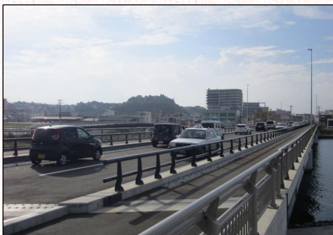
内海橋供用の様子