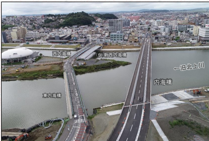
内海橋完成状況(内海橋湊地区から望む)