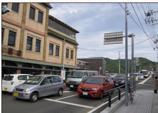
旧観慶丸商店前付近の様子