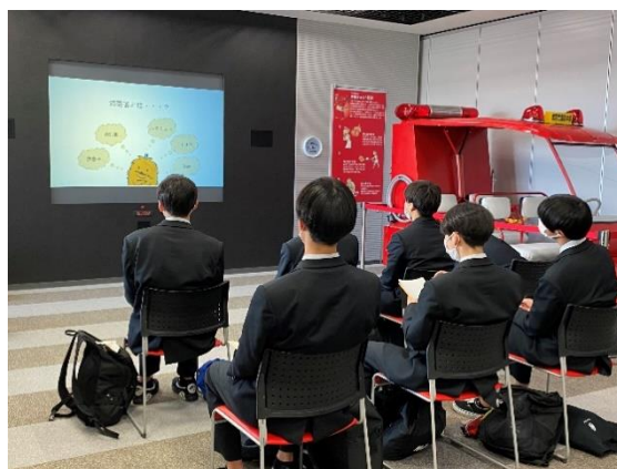
フィールドワークの様子（2年生10月県内の様々な施設や事業所などを訪問）