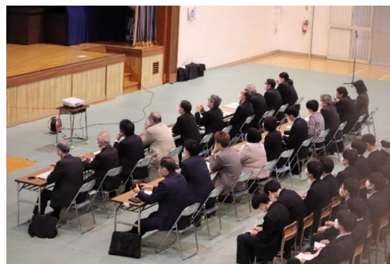
探究成果発表会（2年生3月 市長・市議会議員の方々へのプレゼンテーション）