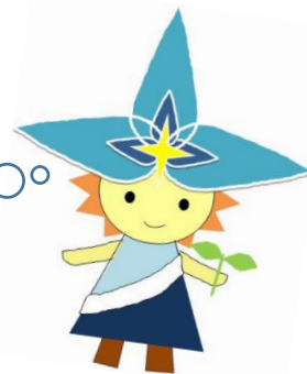
ひがまつさん（本校卒業生作）