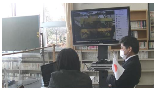
〈令和4年度リモート交流の様子〉

近年は新型コロナウイルスの感染拡大に伴い対面での交流ができませんでした。そうした中でも、メールでの交流、昨年度は対面でのリモートによる交流を行いました。リモートでの交流では学校紹介とともに普段の授業や実習で取り組んでいる学習内容について発表を行いました。