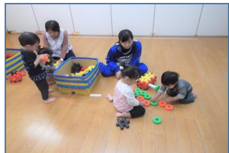
企業実習（保育所）の様子

＜ 学校のホームページはこちらです ＞ https://ichisho.myswan.ed.jp/