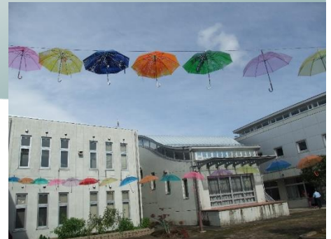
※写真は昨年度の文化祭のものです。

< 学校のホームページはこちらです > https://zao-h.myswan.ed.jp/