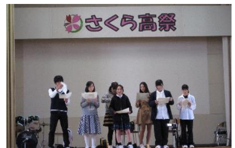
写真は昨年度のもの

< 学校のホームページはこちらです > https://tajiri-hs.myswan.ed.jp/