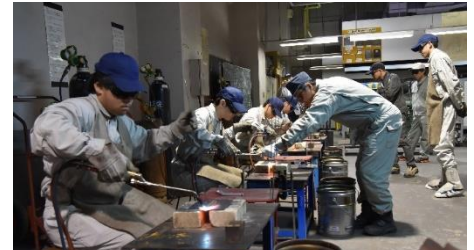
実習風景（電子機械科）

< 学校のホームページはこちらです > https://m2k.myswan.ed.jp/