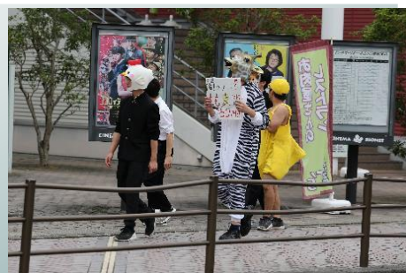
古高祭 仮装パレードの様子 (令和元年度)

< 学校のホームページはこちらです > https://furuko.myswan.ed.jp/