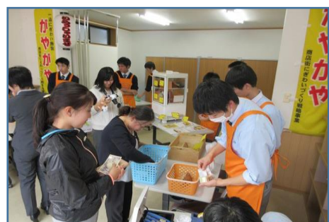
一商チャレンジショップ