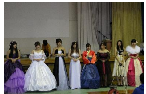
写真は昨年度のもの