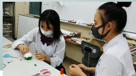
お守り作成の様子

このコロナ禍の中、お客様と直接お話しできるという“日常”，“松島に来てくださるお客様”への感謝の気持ちが日に日に強くなっています。生徒たちは秋の観光シーズンを前に、「手作りアマビエ様お守り」で感謝の気持ちを示したいと、お渡しできる日を目指し、教室での勉強に励みながら制作にも精を出しています。