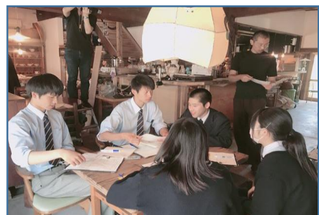
起業家研究 打合せの様子