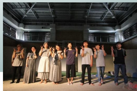
昨年の演劇特別授業風景

周囲の生徒からの支えや講師、先生方からの励ましを得て、日々成長していく生徒の姿が毎年見られたのですが、残念ながら今年は見ることができませんでした。来年こそは一層充実した4日間になるよう願っています。