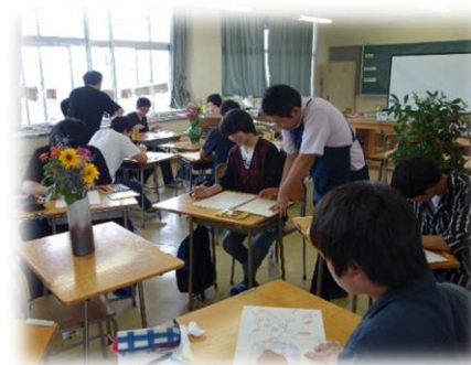
「イラストレーション表現」 授業風景