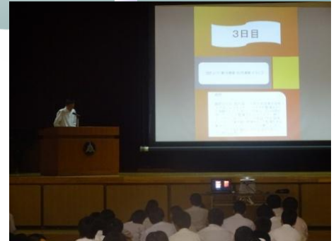
インターンシップ発表会（昨年度）

今年は夏季休業がやや短くなりますが、村高生はそれぞれの熱い夏を経験し、人間的にも大きく成長します。