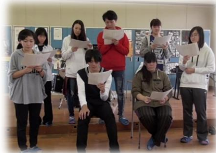
「声とからだのレッスン」 授業風景

< 学校のホームページはこちらです > https://tajiri-hs.myswan.ed.jp/