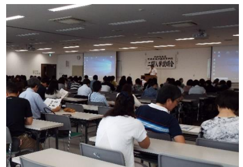
＜令和元年8月二期入学説明会＞

＜学校のホームページはこちらです＞ https://mitazono.myswan.ed.jp/