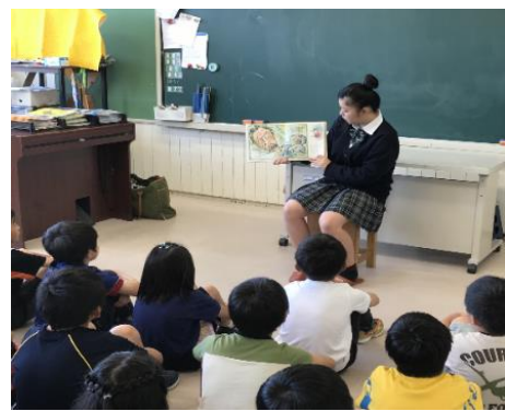
＜岩出山小での絵本の読み聞かせ＞

＜学校のホームページはこちらです＞ https://iwadeyama-h.myswan.ed.jp/