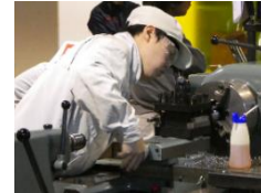
コンテストへの挑戦（一例）

< 学校のホームページはこちらです > https://shiroishi-kougyou.myswan.ed.jp/