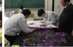
キーホルダーづくり