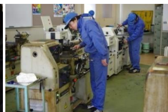
機械・自動車系列