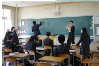
言語・自然科学系列

< 学校のホームページはこちらです > https://murata-h.myswan.ed.jp/