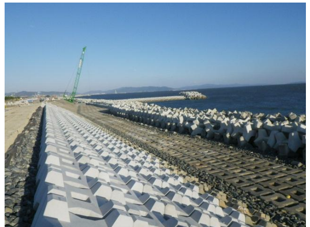
【大曲地区海岸の突堤工事状況】