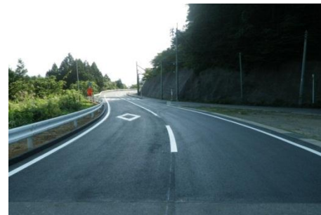
【(一)釜谷大須雄勝線 石巻市雄勝町桑浜(1)地内】