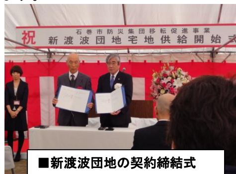
■新渡波団地の契約締結式