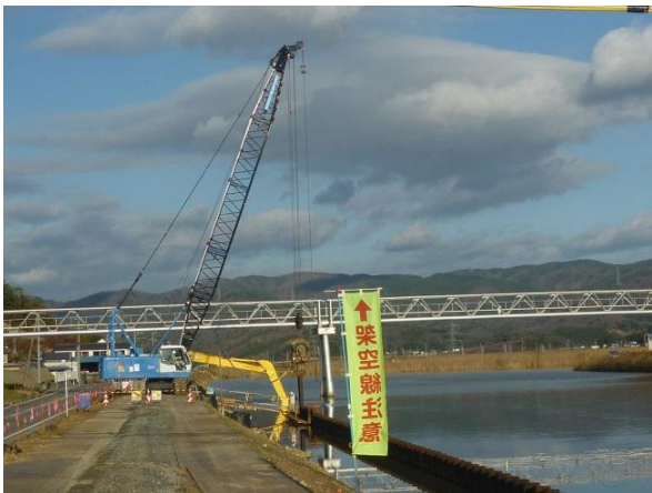
【真野川の右岸基礎工事状況】