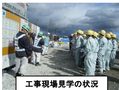
工事現場見学の状況

震災復旧・復興事業の現場から多くのことを学び、将来に活かしていただければ幸いです。