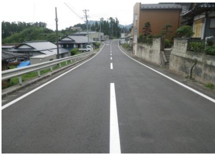
【(一)釜谷大須雄勝線 石巻市雄勝町大須(2)地内】