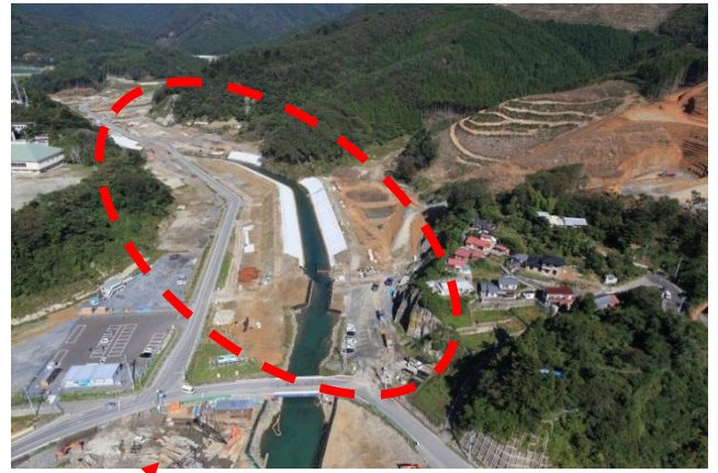
【女川の築堤護岸工事状況】