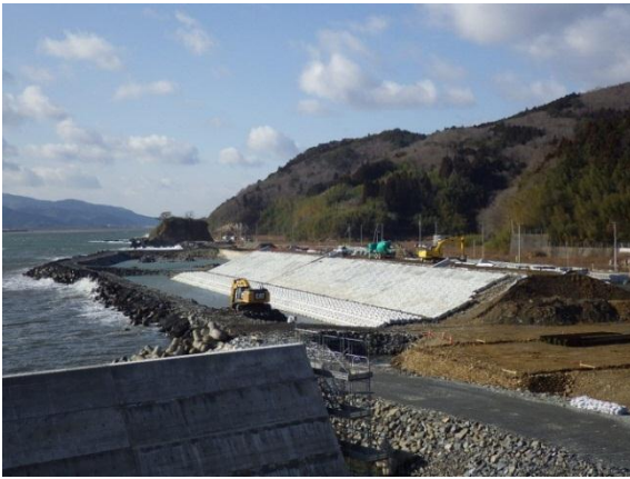
【長塩谷地区海岸の築堤護岸工事状況】