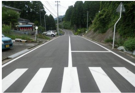
【(一)釜谷大須雄勝線 石巻市雄勝町大須(3)地内】