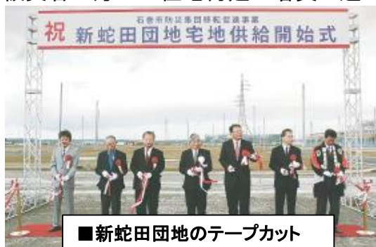
■新蛇田団地のテープカット

防災集団移転事業により整備が進んでいる石巻市の新市街地5地区のうち、平成26年11月3日には新蛇田団地で、11月15日には新渡波団地で住宅供給開始式が開催されました。被災者の方々の住宅再建が着実に進んでいます。