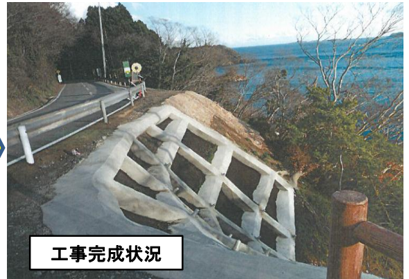
【(国)398号 女川町桐ヶ崎地内】