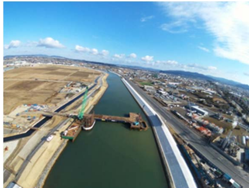
【(都)矢本門脇線 (仮)新定川大橋施工状況】