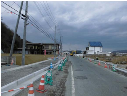
【(都)大街道石巻港線 施工状況】