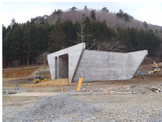
【(国)398号 御前浜工区 施工状況】