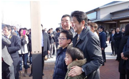
女川中心部被災市街地土地区画整理事業の視察状況