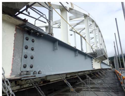
【(主)石巻鮎川線万石橋 石巻市渡波地内】