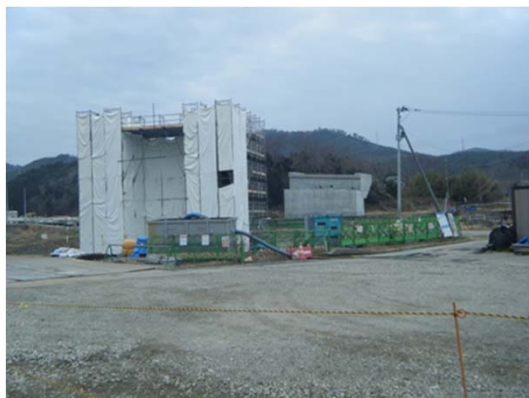
【(主)石巻雄勝線 十八成浜工区 淀川橋施工状況】