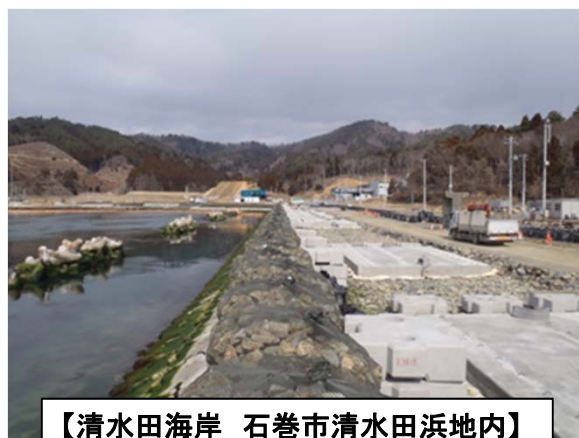
【清水田海岸 石巻市清水田浜地内】