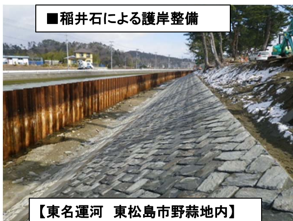
■ 稲井石による護岸整備