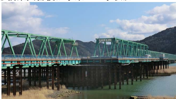
【(国)398号新北上大橋 石巻市北上町橋浦地内】