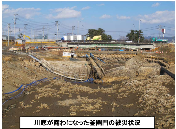
川底が露わになった釜閘門の被災状況