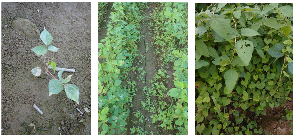
写真 4 大豆ほ場に発生した帰化アサガオ類 (令和 4 年 大崎市古川)