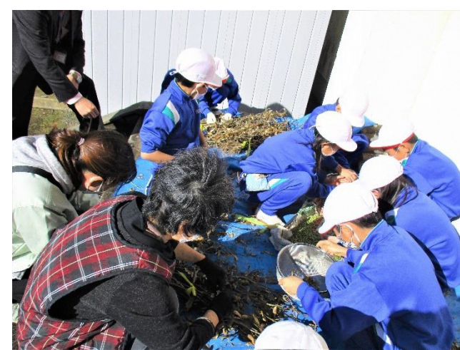
【大豆の栽培・豆ぶち体験】