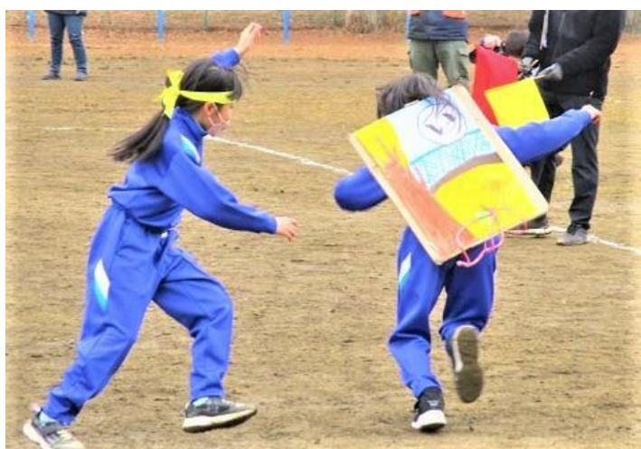
【動くジャンボカルタ取り大会】