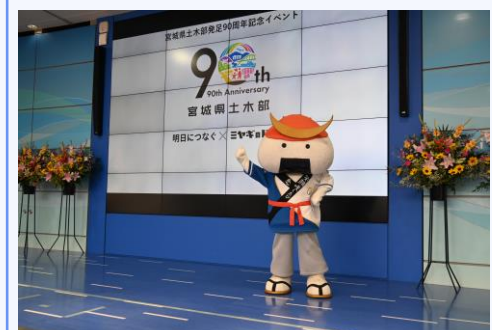
イベント会場には、 むすび丸も出陣しました！

『インフラ異常箇所通報システム』『宮城県土木部公式Instagram』『インフラフォトコンテスト』の詳細は、本紙裏面をご覧ください。