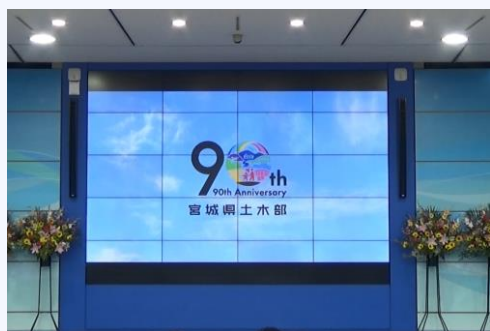
宮城県土木部発足90周年 記念ロゴの発表

宮城県土木部は昭和8年(1933年)に発足し、今年で90周年を迎えたことから、この節目に県民の皆様の土木・建築行政への興味・関心を高め、より一層の親近感を持っていただくために、90周年記念イベントを仙台国際空港で開催しました。