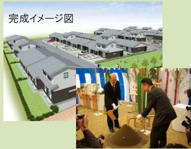
山元町長、県土木部長による入札▲

災害公営住宅は、整備計画戸数15,000戸のうち、3,141戸に工事着手しております。そのうち、石巻市や岩沼市、山元町など6市町の14地区、994戸については、県が市町からの委託を受け、設計及び工事を実施する予定です。 この度、県が受託する工事の第1号として、山元町新山下駅周辺地区第一期の工事が始まりました。平成25年3月の工事完了に向けて整備を進めていきます。