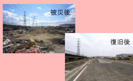
▲応急復旧状況(港北工業幹線)