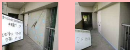
▲県営住宅 七ヶ浜松ヶ浜住宅 復旧前後

県営住宅は、管理する102団地全てが被災しました。津波による全壊、外壁クラック、床上及び床下浸水等被害の他にも地盤や擁壁などに多くの被害が生じました。大規模な被害を受けた21団地のうち、全壊被害のあった2団地を除いた19団地については、平成23年3月～4月に工事請負契約を行い復旧工事に着手、平成24年3月末までに完了しています。