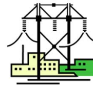
系統との適合性評価