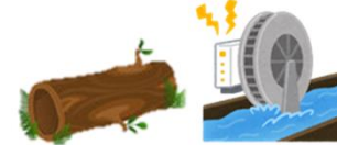
再生可能エネルギー供給可能量