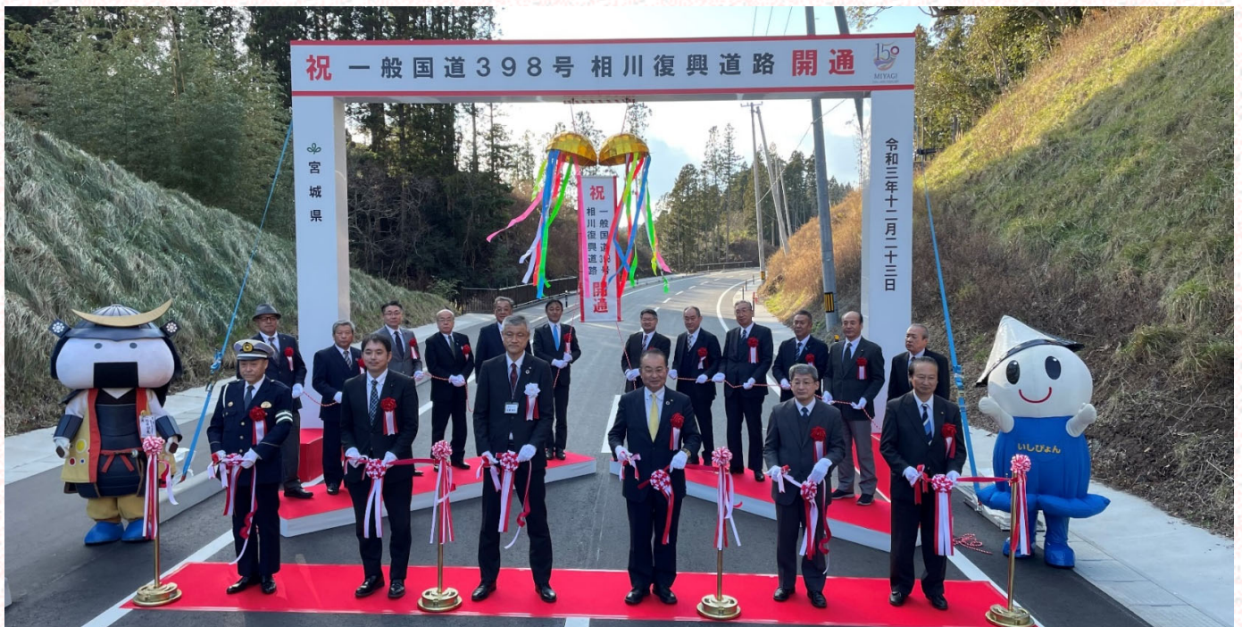
写真 テープカット・くす玉開披の様子