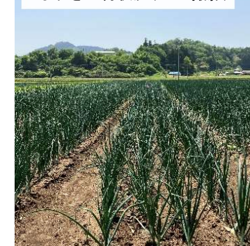
たまねぎ生育状況(R5.5撮影)