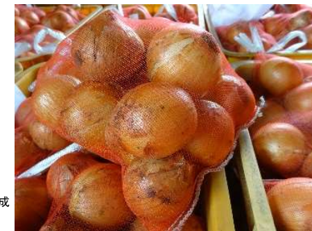
地元販売会向けに調製したたまねぎ