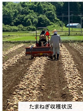
たまねぎ収穫状況