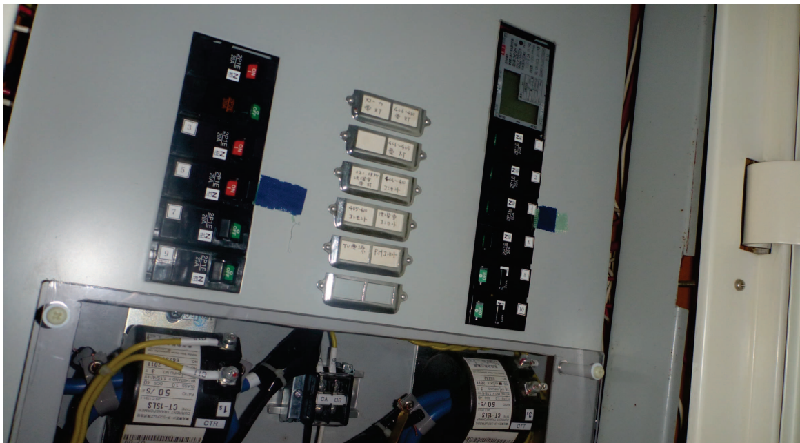
平成24年に内部機器が交換された分電盤内