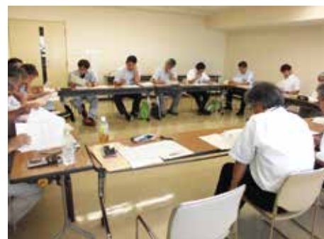
農地集積検討会の様子 (中名生・下名生地区)

(参考) 完了地区:毛萱(角田市)、薄木(村田町)、西根(角田市)、日向前(角田市)、金ヶ瀬(大河原)、向原(川崎町)、枝野(角田市)、槻木(柴田町)、川崎東部(川崎町)、越河(白石市)、円田2期(蔵王町)