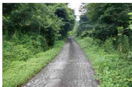
柳田峠2期地区 (着手前)