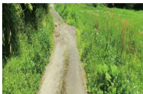
柳田峠2期地区 (着手前) 起点側