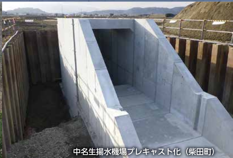
中名生揚水機場プレキャスト化（柴田町）