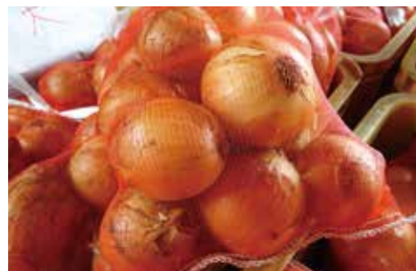
葉坂地区の玉ねぎ (柴田町)