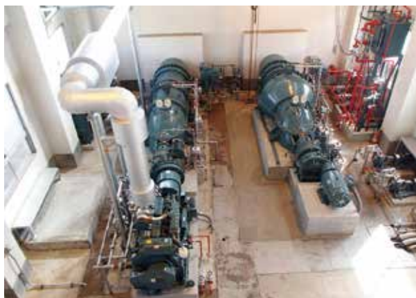
南田排水機場（完成）

自然災害による農地・農業用施設等被害の未然防止，農業用施設の計画的な機能回復，そして防災重点農業用ため池の整備等を行うことにより，農業生産の維持及び農業経営の安定を図り，国土保全や地域住民生活の安全・安定を図ります。