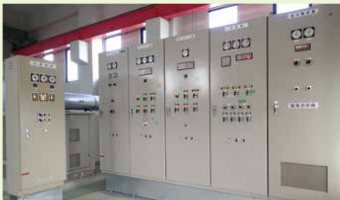
【堀切排水機場（丸森町）の事例】

被災を受けた管内21箇所の揚・排水機場について、設備を復旧するための工事を実施しました。復旧にあたっては、原状復旧にとどまらず、「建屋の水密性の向上」や「電気設備の高位部設置」などの再度災害防止対策もあわせて実施しました。