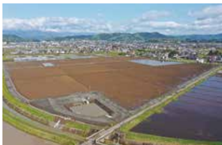
中名生・下名生地区【中名生1工区】 (完成後)