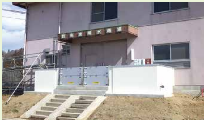
【新舟渡排水機場（村田町）の事例】