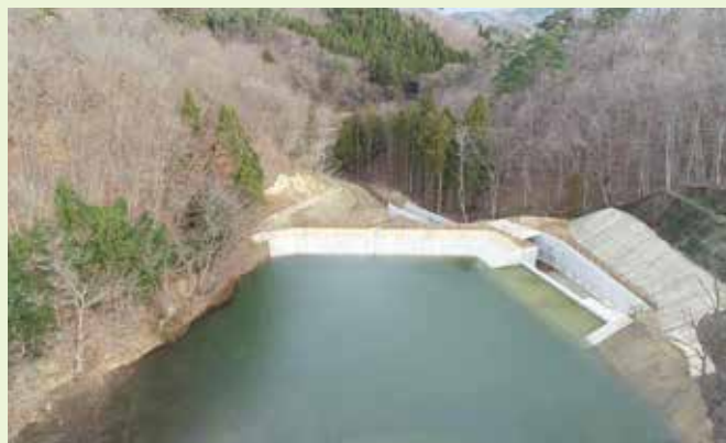
【長柴山ため池 復旧後】