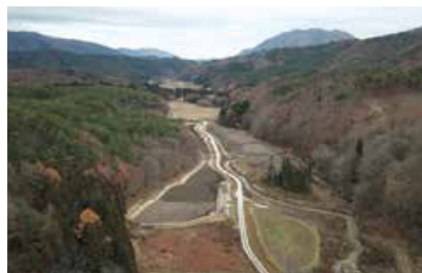
七ヶ宿西部地区【田堀西工区】 (完成後)