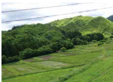
大内青葉棚田 (丸森町大内青葉地区)

注3) 交付金：全体事業費(国費+県費+市町村費) 注4) 端数処理の関係で合計が一致しない場合がある。