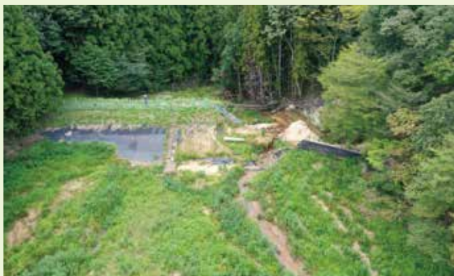
【長柴山ため池 復旧前】

堤体はため池整備指針に基づき、耐震性等を考慮した構造で復旧しており、大雨時の洪水を下流に放流する設備である洪水吐（復旧後の写真）については、設計流量の見直しを行い、従来よりも断面を拡大して復旧しました。