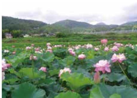
遊休農地を活用したハス田 (白石市八宮地区)