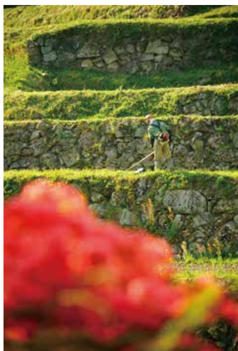
大張沢尻棚田 (丸森町棚田写真コンテスト特選)