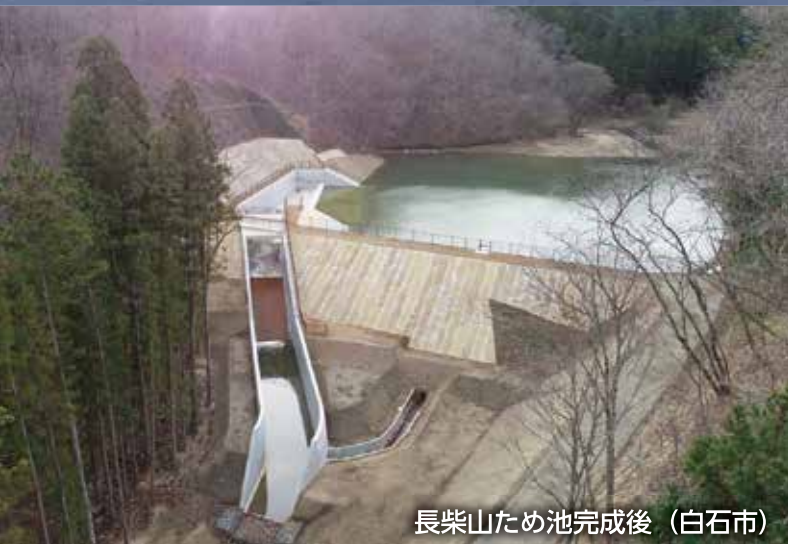
長柴山ため池完成後（白石市）