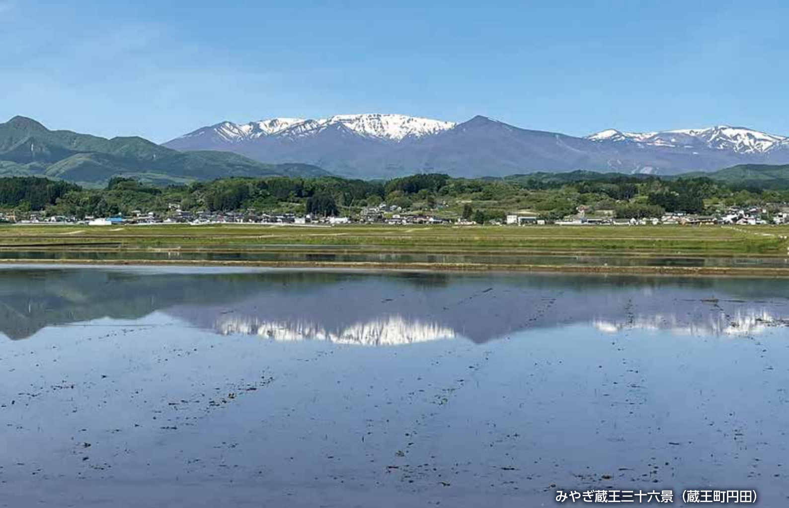
みやぎ蔵王三十六景（蔵王町円田）