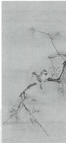
「梅に小禽図」 伊達政宗筆 個人蔵