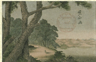
「湖山風景図」 佐竹曙山筆 秋田市立千秋美術館蔵 *前期展示(10/9~11/7)

朝日新聞仙台総局、毎日新聞仙台支局、読売新聞東北総局、産経新聞社東北総局、宮城ケーブルテレビ株式会社