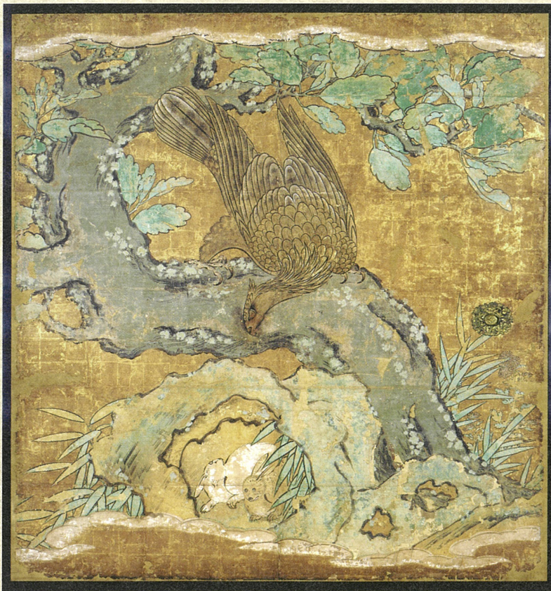
重文 瑞巖寺本堂障壁画「樹に鷹図(鷹に兔)」七面の内 狩野左京弟子九郎太筆 元和八(1622)年 瑞巖寺蔵