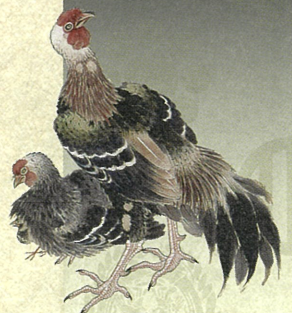
「花鳥」部分 佐々木原善筆 秋田県立近代美術館蔵

※ 新型コロナウイルス感染症対策のため、日程の変更および入場制限を行う場合があります。詳しくは当館ホームページ・SNSでご確認ください。