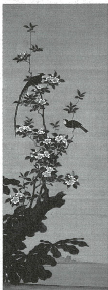
重文 「唐太宗・花鳥山水図」(三幅対) 小田野直武筆 秋田県立近代美術館蔵 *前期展示(10/9~11/7)