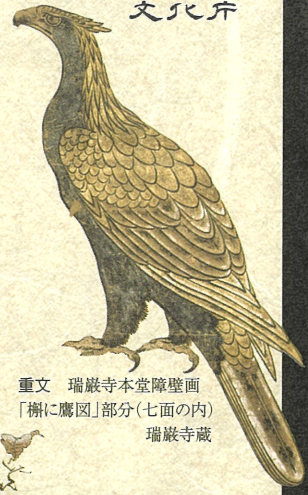
重文 瑞巖寺本堂障壁画 「樹に鷹図」部分(七面の内) 瑞巖寺蔵