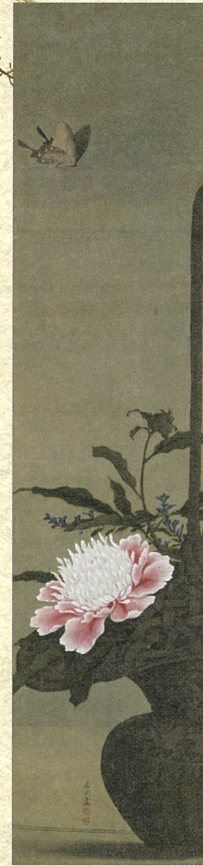
秋田県指定「芍薬花籠図」 小田野直武筆 秋田県立近代美術館蔵 *後期展示(11/9~12/5)