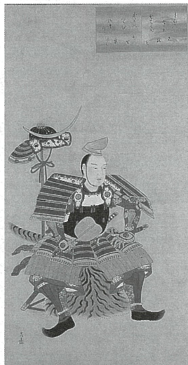
「伊達吉村像」 狩野古信筆/自賛 瑞巖寺蔵

個人の武士を描いた肖像画は鎌倉時代に現れるものの、本格的に制作され始めたのは南北朝・室町時代以降であり、室町時代後期から桃山時代にかけてその数が急激に増える。その特徴は、死後の追善のための肖像画だけでなく、長い贅を伴って武士個人や家の正統性を主張するものが見られるようになる。さらに、江戸時代前期から中期にかけて、各藩では大名の歴史書等の編纂が行われるようになると、江戸時代以前の遠い祖先の肖像画も描かれるようになる。これは、家の正当性を主張するために編纂した系図や家譜に、絵画的イメージを付加する役割があったのではないか。この章では、武家と肖像画の関わりを考える。