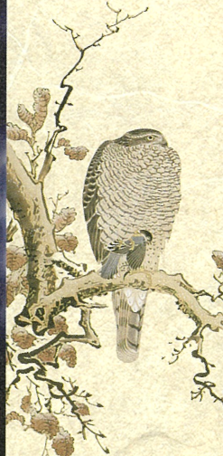
「鷹図」部分(双幅の左) 小川隆雅筆 秋田市立千秋美術館蔵 *前期展示(10/9~11/7)