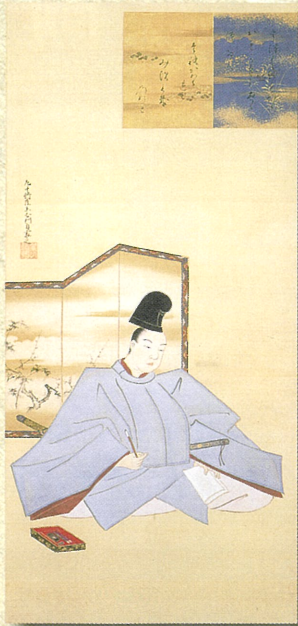
「伊達吉村像」伊達吉村筆/自賛 仙台市博物館蔵