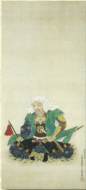
「伊達朝宗像」伊達吉村筆 満勝寺蔵