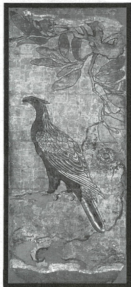
重文 「瑞巖寺本堂障壁面 櫺に鷹図(鷹)部分」七面の内 狩野左京弟子九郎太筆 元和八(1622)年 瑞巖寺蔵

江戸時代中期の18世紀には、博物学が世界的に流行し、日本に於いても武士を初め、学者、商人、豪農に至るまで、さまざまな人々が博物学研究にいそしんだ。その中でも、大きな役割を果たしたのが各地の大名である。彼らによって、さまざまな物を写生・模写した博物図譜が制作されるが、その目的に最も合致したのが、長崎に來日した中国人画家沈南蘋(しなんぴん)の画風である。沈南蘋は、写実を旨とした細密な花鳥画で知られ、本人はわずか二年で帰国したものの、日本の絵画界へ与えた影響は甚大で、降く間に南蘋風の絵画が日本中に広がった。さらに、秋田藩の小田野直武は、南蘋派の技法を取り入れつつ、それに洋画の技法を融合させた「秋田蘭画」と呼ばれる領域を確立した。このように18世紀の日本では、新たな絵画へ多くのまなざしが向けられ、近代絵画への道のりが既に始まっていたのである。