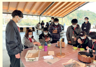
令和4年度の活動の様子

〒981-0412 東松島市宮戸字ニツ橋1 ☎0225(90)4323 FAX 0225(88)2901 午前9時～午後5時 休館日/月曜