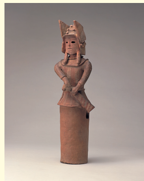
重要文化財 埴輪武装男子半身像 東北歴史博物館所蔵

古墳から発見された埴輪(はにわ)や副葬品を用いて、埴輪を製作した専門的な工人集団や古墳築造に携わった人々を紹介します。一連のストーリーの中で、歴史を学び始めた子どもたちにも古墳時代について分かりやすく伝えます。