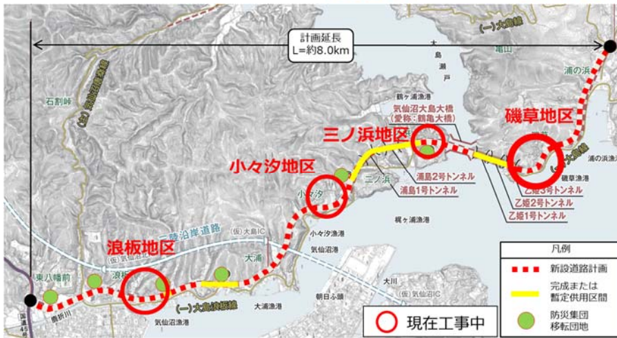
磯草地区の工事が始まりました