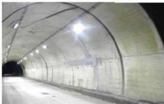
漏水対策の実施 [(国)113号 小原4号トンネル(白石市)]