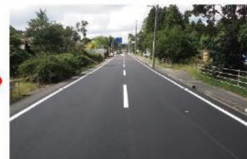
舗装補修 [(国)457号(大和町)]