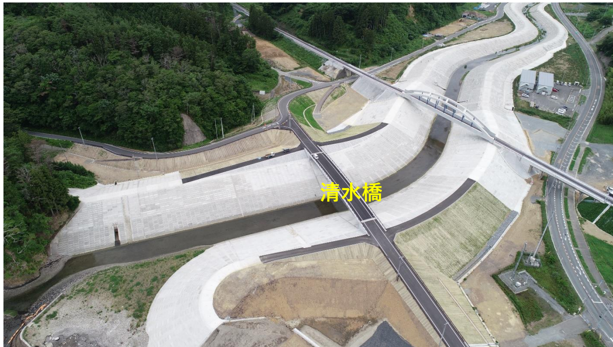
南三陸町 桜川（中間に映る橋が清水橋）