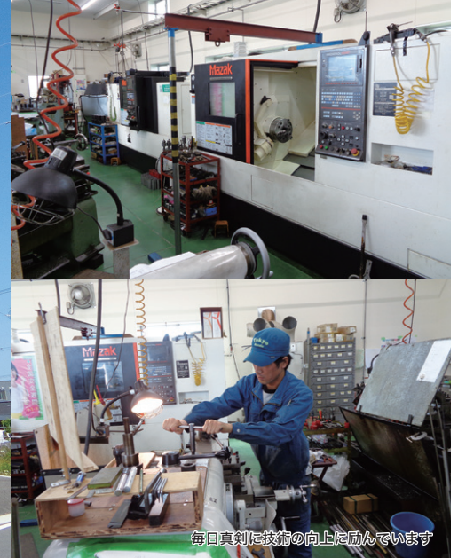
毎日真剣に技術の向上に動んでいます

戦後より、気仙沼にて船舶機関部品の修理・製作事業をはじめ、現在ではそのノウハウを活かし、船舶に限らず産業機械部品や特注部品等の修理・製作と幅広い対応をしています。