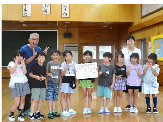
【2年生の部】登米市立錦織小学校(2-1)