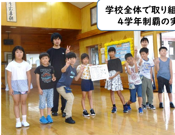
【3年生の部】登米市立錦織小学校(3-1)