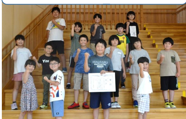
【混合の部】気仙沼市立月立小学校（全校）

前期の長なわ跳び大会には、13校44チームが参加し、記録を競い合いました。また、短なわ跳び大会にも、のべ436名が参加しました。マラソン大会には11校67チーム、1093名の参加がありました。