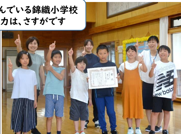
【4年生の部】登米市立錦織小学校(4-1)