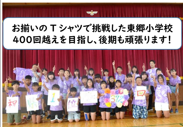
【6年生の部】登米市立東郷小学校(6-1)