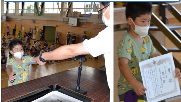
【1年生の部】石巻市立鹿妻小学校(1-2)