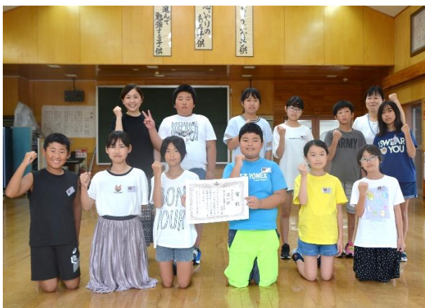
【5年生の部】登米市立錦織小学校(5-1)