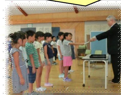
登米市立錦織小学校 5・4・1年生 すご〜い！