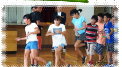
登米市立西郷小学校6年生 おめでとう！