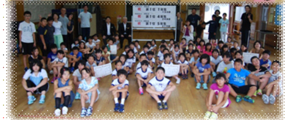
登米市立米川小学校 3・2・混合学年に続け！