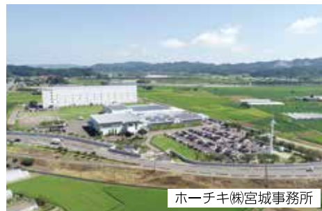
ホーチキ(株)宮城事務所