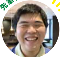
製品組立 入社 2 年目

私は入社後、約半年で製品の組立や精密な調整などの仕事を任せられています。特に調整作業は難しいですがやりがいがあり、周りの先輩方や関係職場のサポート体制もしっかりしております。困った時には皆で支え合う事が出来るとても働きやすい会社です。