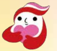
犯罪被害者等支援シンボルマーク「ギョつとちゃん」

ご理解とご協力がとても重要です。 家族や知り合いが、もし犯罪被害に遭ってしまったら? 犯罪被害に関する問題は決して人ごとではありません。 この機会に、「犯罪被害者支援」の重要性について考えてみませんか?