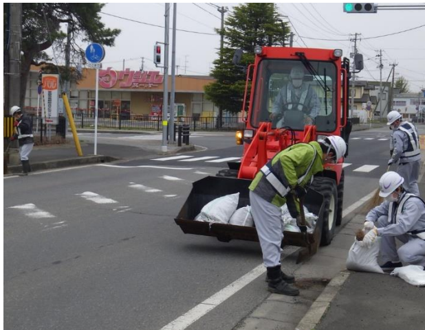
上田建設(株) (4月15日 除草・清掃) (一)若柳花泉線(若柳)