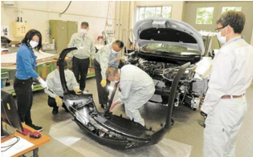
R3年度 自動車部品機能・構造研修