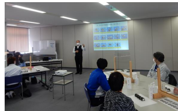
R3年度 ものづくり「改善」入門