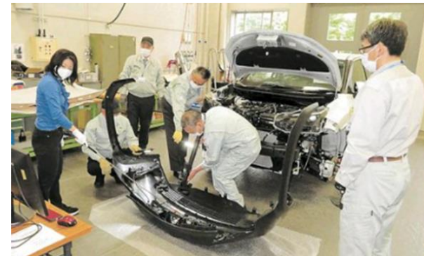
自動車部品機能・構造研修事業 (R3年度 講座1:自動車産業入門編)