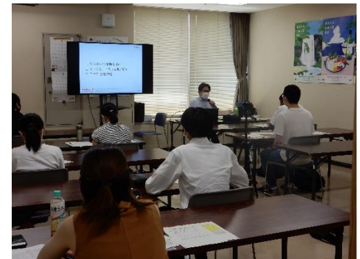
みやぎカーインテリジェント人材育成センター事業 (R3年度 B1講座:「生産・開発」講座)