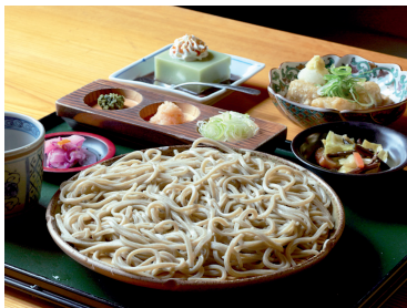
七ヶ宿のそばをご賞味あれ

「そば街道」としても知られる七ヶ宿町。町内にある5軒のそば屋では、風味豊かな七ヶ宿産のそば粉を