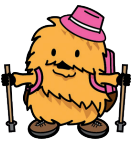
栗原市マスコットキャラクター 「ねじりほんによ」