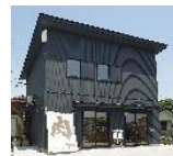
本社(精肉店兼加工センター)