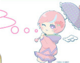
川内沢ダム イメージキャラクター 「川内あい」

付替道路工事については、着々と進んでいますね！ ダム仮設工事にも着手し、ダム本体工事に向けた準備が整ってきました！