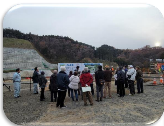
高館公民館「高館防災学校」の状況①