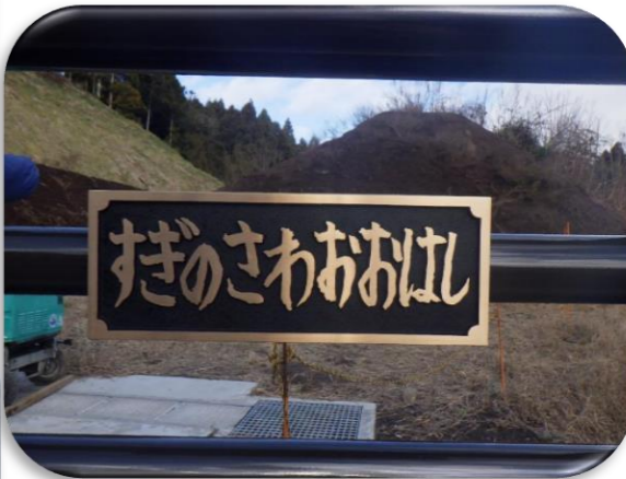
杉の沢大橋の橋銘板揮毫②