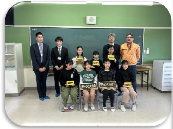
杉の沢大橋の橋銘板揮毫①