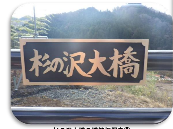
杉の沢大橋の橋銘板揮毫③