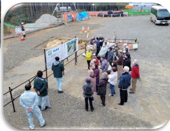
高館公民館「高館防災学校」の状況②