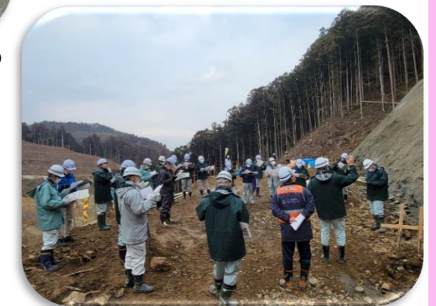
第3回ダム建設事業研修②

●内容についてお気付きの点やご質問等は下記までご連絡ください。 宮城県仙台地方ダム総合事務所 建設班 TEL 022-372-2927 FAX 022-375-7535 E-mail sddamke@pref.miyagi.lg.jp