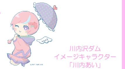
川内沢ダム イメージキャラクター 「川内あい」

付替道路工事は、着々と完成に向けて進んでいますね！ 愛島公民館まつりは、来場者から大変好評でしたね。