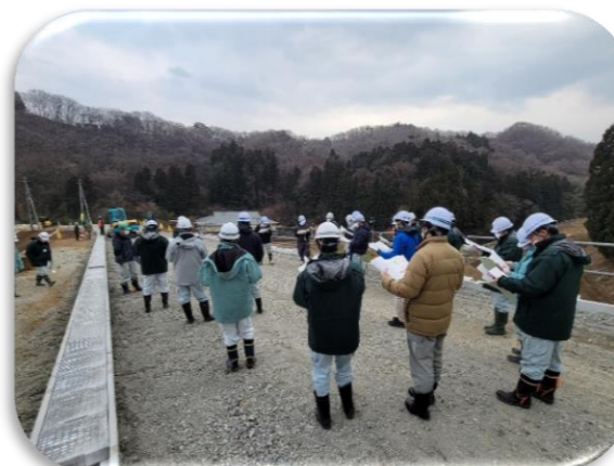
第3回ダム建設事業研修①