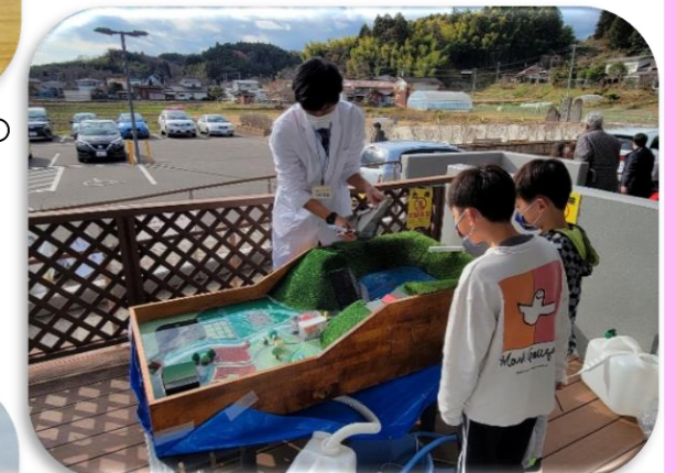
愛島公民館まつりの状況②