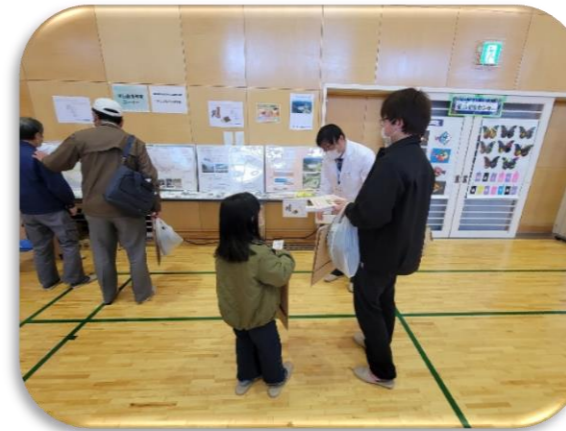
愛島公民館まつりの状況①