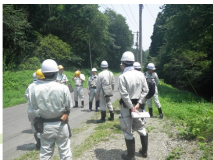
ダムサイト予定地の説明

専門家により、主にダム予定地付近の地形やボーリングコアでの地質の状態を確認され、現状の課題と、今後の追加調査などについての助言をいただきました。この結果を参考に、追加のボーリング調査及びダムサイト・ダム形式の確定に向けての検討を進めてまいります。