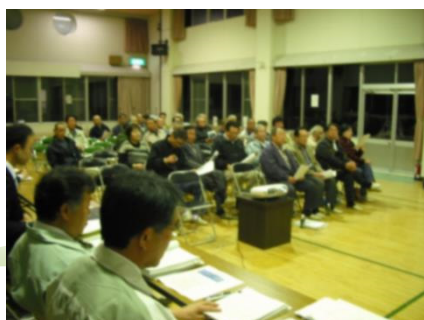
愛島公民館での説明会状況