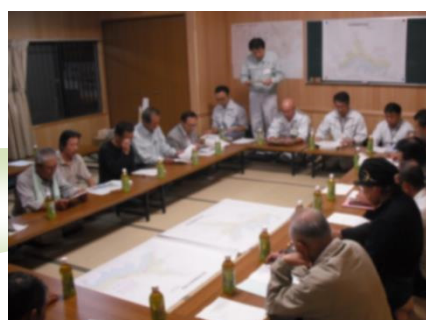
川内中ノ沢集会所での説明会状況