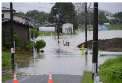
善川右岸 (海老沢橋周辺) 村道浸水被害