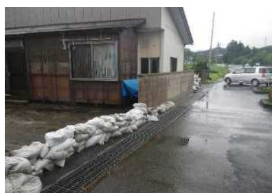
善川左岸 (古舘橋周辺) 土のう積み