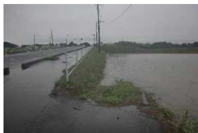
善川左岸 (古舘橋周辺) 水田浸水被害