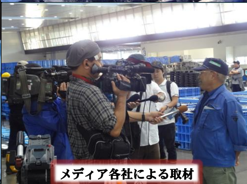
メディア各社による取材