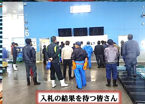
入札の結果を待つ皆さん