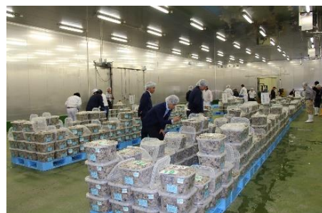
▼ かきの入札の様子

これから寒さが厳しくなるにつれ，宮城県産のかきもどんどん美味しくなりますので，皆さんも「美味しく，安心・安全な宮城のかき」を是非ご賞味ください。