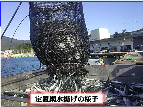
定置網水揚げの様子

「ホウボウ」は深海に生息する魚で、翼のようなヒレと頭の大きさが特徴的です。身は白く刺身、煮付け、唐揚げ、塩焼きなど様々な料理に向いています。