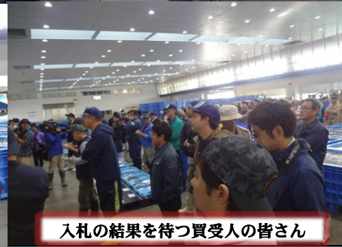
入札の結果を待つ買受人の皆さん