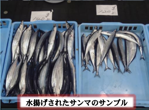
水揚げされたサンマのサンプル